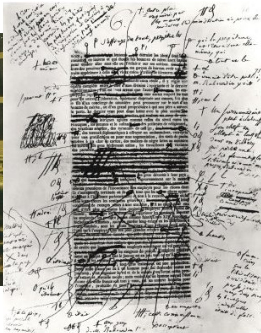
בלזאק קשה על עצמו